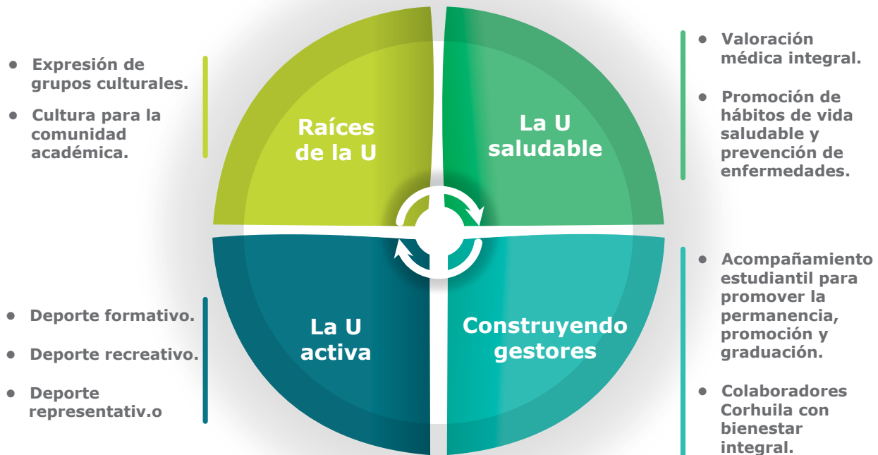
Ilustración 2 Líneas de acción de la Política de Bienestar Institucional