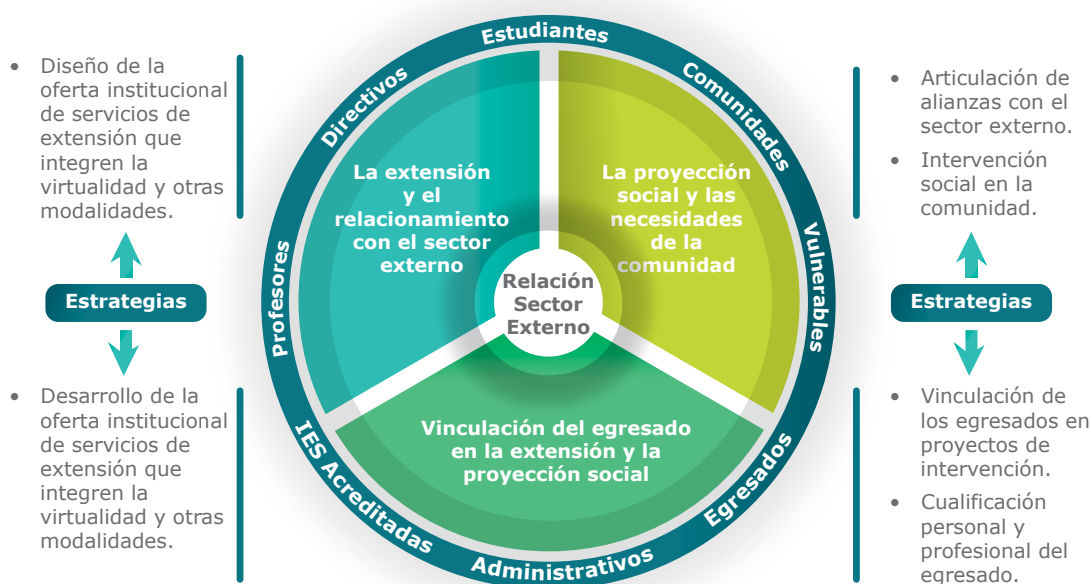
Ilustración 1 Modelo de Extensión y Proyección Social

La siguiente ilustración presenta el alcance de la Política de Extensión y Proyección Social: