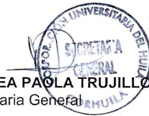
ANDREA PAOLA TRUJILLO LASSO Secretaria General

📍 Sede Quirinal: Calle 21 No. 6 - 01 📍 Sede Prado Alto: Calle 8 No. 32 - 49 PBX: (608) 8754220 📍 Sede Pitalito: Carrera 2 No. 1 - 27 - PBX: (608) 8360699 ✉ Email: contacto@corhuila.edu.co - www.corhuila.edu.co